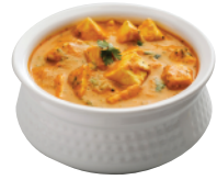
인도의 음식 카레