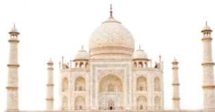
인도의 건축물 타지마할